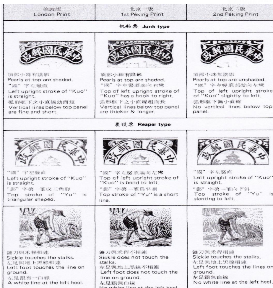
Fig 3 De verschillen van de drie Jonkenseries, vlg de Chan 1992, blz. 51

Alle uitgegeven drie Jonken series zijn goed te verzamelen, omreden dat deze goedkoop. tot zeer goedkoop zijn te verwerven, echter voor de dollarzegels staan hogere prijzen in de catalogussen genoemd, het gaat hier om de Mi nrs. 165 I t/m 168 I, Mi 165 I t/m 169 II en Mi 205 t/m 209.