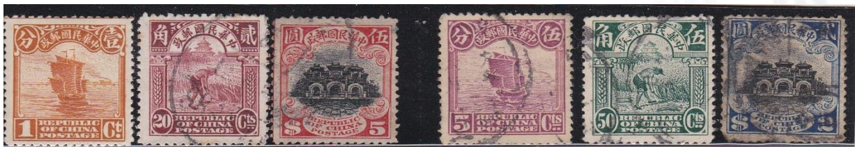
Fig. 1 eerste uitgifte Mi nrs.148- I t/m 168- I en tweede uitgifte Mi nrs. 148-I t/m 169-II

De 1e uitgifte, de London Print, is gedrukt door "Waterlow & Sons", in Londen op wit papier zonder watermerk, met tandingenvarianties van 14 tot 15, en voor het eerst uitgegeven, in mei 1913 door de Chinese Republiek. De cent waarden zijn gedrukt op vellen van 200 stuks of velletjes van 25 stuks. De dollar waarden zijn gedrukt op velletjes van 50 stuks. Als we de series nader bekijken onderscheiden we drie afbeeldingen, t.w. de Jonk, de Oogster en de het gebouw van het Klassieke Peking. De tanding voor deze serie is 14 - 15. (zie fig. 1 en 2).