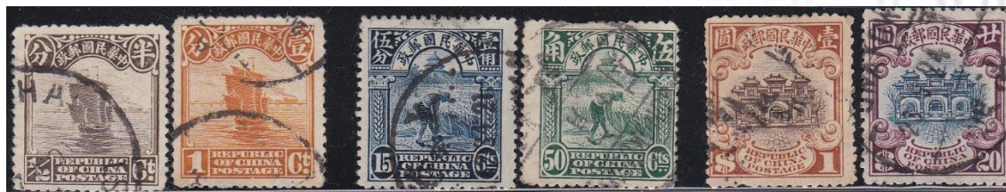
Fig 2 derde uitgifte Mi nrs. 187 t/m 209

De 2e uitgifte, de Eerste Peking uitgifte (fig.2) genoemd, is gedrukt na het uitbreken van de 1e wereld oorlog in 1914. Niet in Engeland maar in China is deze 2e Jonkenserie gedrukt, in 1914. De oorzaak dat de 2e uitgifte in China is gedrukt, waren de hoge drukkosten t.o.v. de drukkosten in Peking. Deze serie kreeg de naam "The First Pekingdruk" maar de Michel en de Stanley Gibbons noemde deze druk, de 2e druk. De verschillen tussen de Londen print en de Peking print worden beschreven in fig.3. Een beroemde fout is de 2 dollar (inverted center Mi nr 166 II). Een velletje van 50 zegels was ontdekt in het postkantoor van Hankou. Er is voor deze uitgifte, in de beginfase, verschillende soorten erg dik en dunner papier gebruikt met een tanding van 14. De zegels van de eerste Pekingdruk zijn in grotere aantallen gedrukt dan die van de London Print.