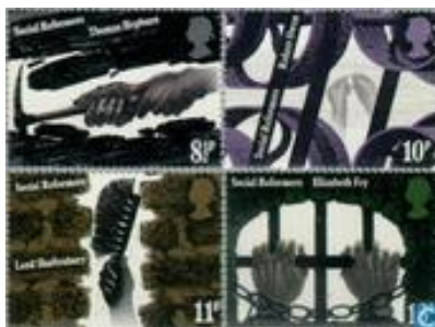
1 zegel uit serie Sociale hervormers van 4 uit Groot Brittannië (het blokje van 4 is gekopieerd van Catawiki)