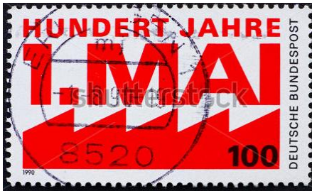
100 jaar 1 Mei 1990 Duitsland