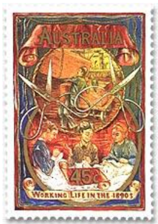
1 zegel uit serie van 4 leven en werken in 1890