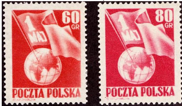
1 Mei zegels Polen 1953