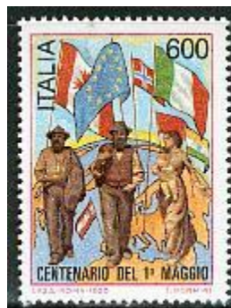
Dag van de arbeid 1990 Italië