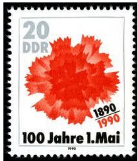
100 jaar 1 mei 1990 DDR