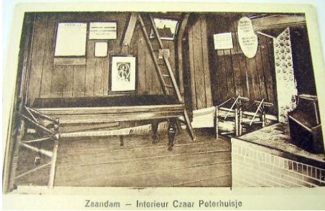
Zaandam – Interieur Czaar Peterhuisje

Peter kwam in Augustus 1697 naar Nederland want hij wilde alles weten omtrent de ontwikkelingen in de scheepsbouw. Na een kort verblijf in Zaandam verhuisde hij naar een huisje op de Oost-Indische werf op Oostenburg en vanaf begin september 1697 tot half januari 1698 werkte hij mee aan de bouw van het fregat Petrus en Paulus, genoemd naar de patroon heiligen van St.Petersburg.